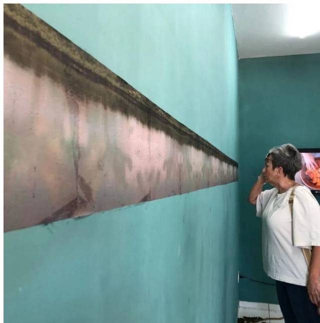
Figura 02 - Exposição "Atravessar Musgo".

Imagem disponível no perfil de Instagram da Candeeiro.