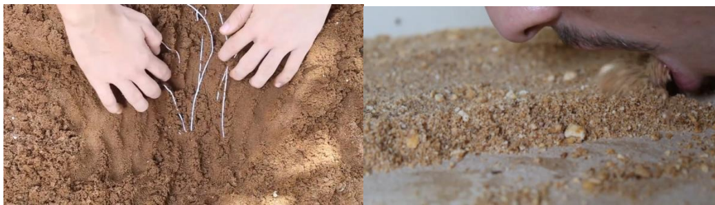
Prints do vídeo.

Terreiro-Quintal-Chão (2023) apresenta seres que integram o quintal do artista. O destaque ali é no caráter multiespécie deste ambiente: seres humanos, não-humanos, vivos, não-vivos, orgânicos, inorgânicos, naturais, artificiais, animais, vegetais, fúngicos, entre outros que constroem, dialogam, atravessam, disputam. Não somente isso, o quintal se apresenta como um entre-lugar, interno-externo, privado-público, meu-nosso. Como afirma Donna Haraway (2021), cada uma dessas denominações marca um discurso que herdamos na carne e suas consequências.