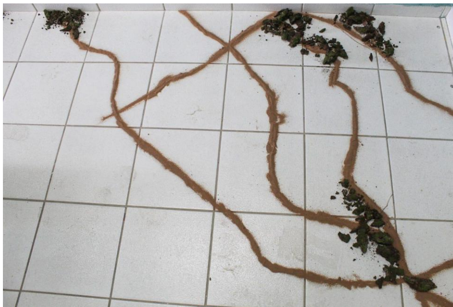
Figura 01 - Emaranhados no chão.

Imagem cedida pelo artista (Diego Dionísio).