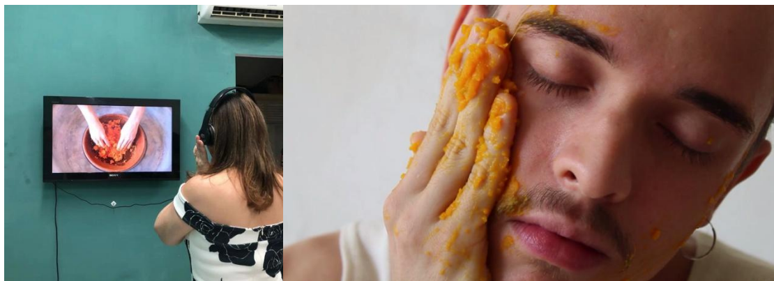
Figura 03 e 04 - Mãos que devoram .

Imagem retirada no perfil de Instagram da Candeeiro (à esquerda) e imagem retirada da monografia de Diego Dionísio (à direita).